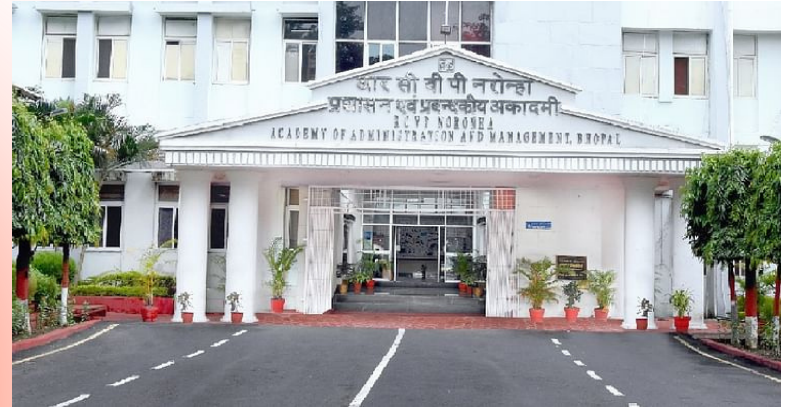
RCPV Noronha Academy of Administration and Management, Bhopal

A three-day 'Sarthak Edu-Vision' event, comprising an exhibition and conference for Aatmanirbhar Bharat, was held at the RCPV Noronha Academy of Administration and Management, Bhopal between March 15 and 17.