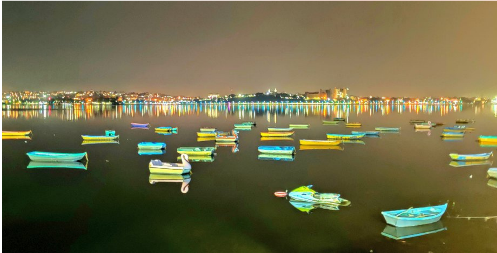
City of Lakes, Bhopal